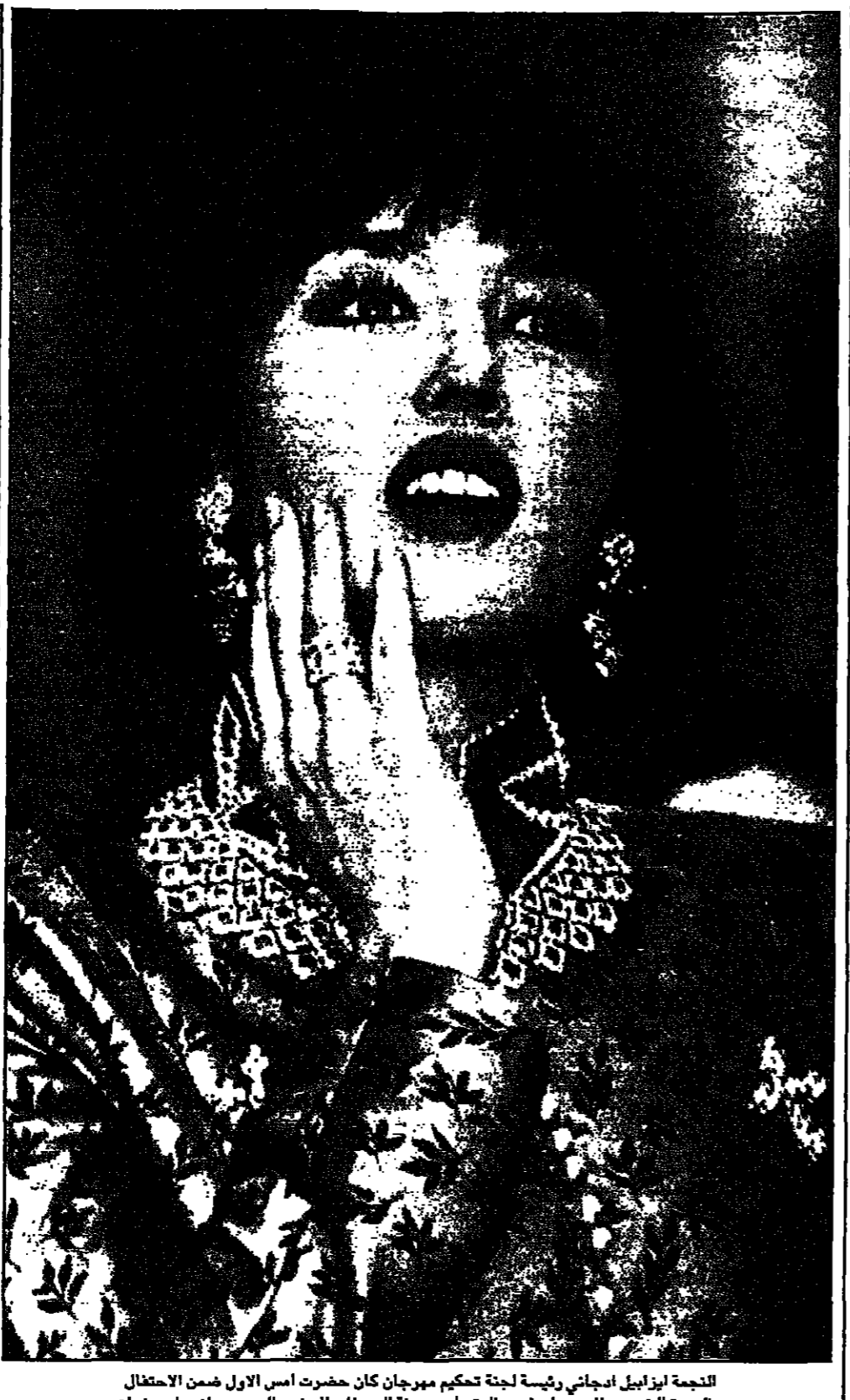
الجمعة ايزابل ايجاتي رئيسة لجنة تحكيم مهرجان كان حضرت اس الاول ضمن الاحتفال بالدورة الخمسين للمهرجان في حفل تسليم سبعة السفاحات للمخرج السويدي انجمار برغان

انت تصريحات الكاتب انيس منصور... بالقاهرة - القدس العربي انت تصريحات الكاتب انيس منصور... بالقاهرة - القدس العربي